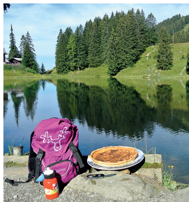
Tönt salzig, ist aber süss: Die Salée ormonanche schmeckt besonders gut am Lac Retaud.