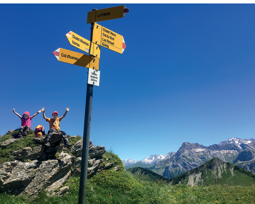
Kleines Gipfelglück auf dem Col des Andrérets.

Resto d'Isenau, 024 492 32 93, www.isenau.ch Besenbeiz Chalet d'Isenau: 076 577 09 69 Buvette Chalet Vieux, 079 561 74 48 Restaurant Lac Retaud, 024 492 13 68, www.lacretaud.ch