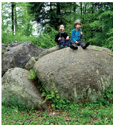
Zwei Findlinge, zwei Picknicker: Cervelats essen auf den Zeitzeugen.