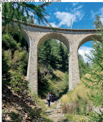
Das Viadukt der Rhätischen Bahn im Val da Pila.