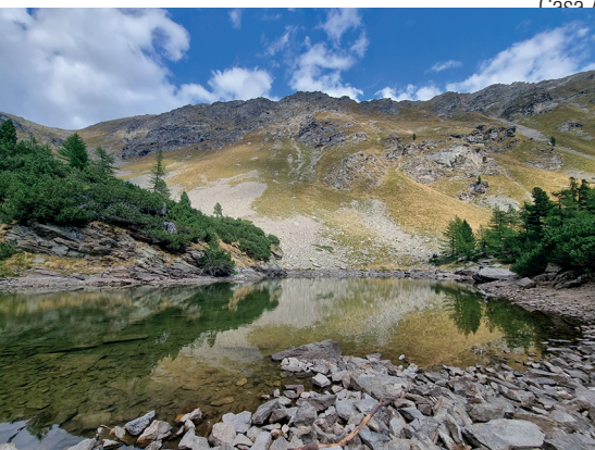
Der Lagh da l'Ombrina ist etwas versteckt – aber der Abstecher lohnt sich.

Stazione Cavaglia Albergo Ristorante, Poschiavo, 081 834 61 55, www.stazionecavaglia.ch Casa Alpina Belvedere, Alp Grüm