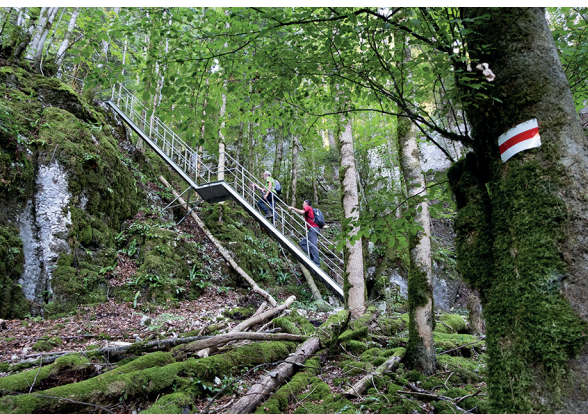
Leitern und Treppen vereinfachen den Aufstieg nach Le Noirmont.

Restaurant Le Theusseret, Goumois, 032 951 14 51, www.letheusseret.blogspot.com Restaurant de la Goule, Le Noirmont, 032 953 11 18, www.restaurantdelagoule.ch