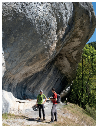
Zeuge jahrtausendelanger Erosion: der Felsunterstand Blanche-Eglise.