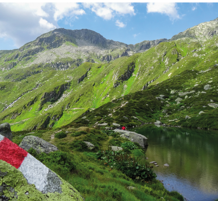
Der Lag Serein: ob der Name vom Lateinischen serenus (heiter, hell, ruhig) kommt?

Erreichbar ist Caischavedra mit der Bergbahn von Pendericlaras aus. Von Disentis fährt ein Ortsbus zur Talstation. Fahrplan unter www.disentis-sedrun.graubuenden.ch