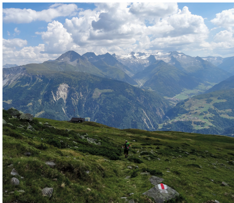
Beim Abstieg geht es zeitweise recht steil hinunter.