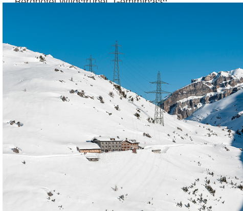
Das Berghotel Schwarzenbach ist in Sicht.