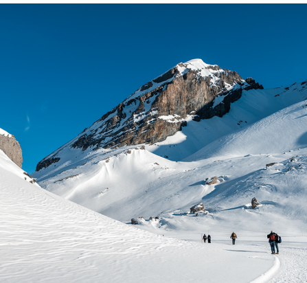
Am Ende des Daubensees biegt der Weg unter dem Chli Rinderhorn in eine Engstelle ein.