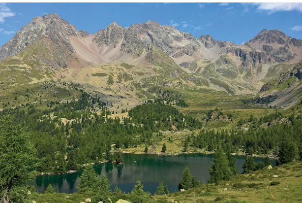
Besonders im Mündungsbereich des Bergbachs in den Lagh da Viola lässt es sich besonders gut spielen.

Obligatorische Postauto-Reservation unter 081 844 10 42 oder 079 599 96 76 Ristorante Pensione Alpe Campo, 081 844 04