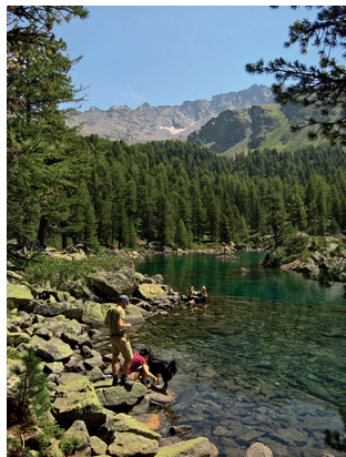
Am Ufer des Lagh da Saseo.