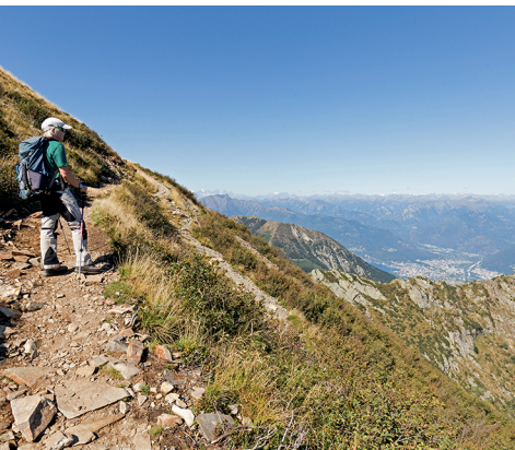
Aussicht von Beginn weg: Aufstieg zum Monte Tamaro.

Seilbahn Monte Tamaro und Alpe Foppa, 091 946 23 03, www.montetamaro.ch Gasthaus und Seilbahn Monte Lema, 091 609 11 68, www.montelema.ch Capanna Tamaro, 091 946 10 08, www.utoe.ch