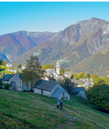
Erster Anstieg nach Rasa, im Hintergrund das Centovalli.

Seilbahn Verdasio &#8211; Ronco, www.centovalli-swiss/turismo/funiviva/