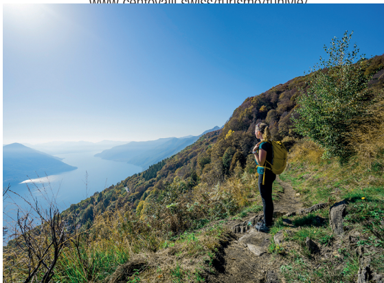
Der Abstieg startet gemächlich und mit einmaligen Aussichten.