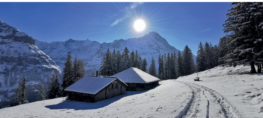
Alphütten Nodhalten, dahinter der Mättenberg (links) und der Eiger.

Grindelwald Bus, 033 854 16 16, www.grindelwaldbus.ch Bergrestaurant Bussalp, 033 736 30 00, www.huettenzauber.ch Restaurant Rasthysi, 078 789 34 21 Firstbahn, 033 828 72 33, www.jungfrau.ch