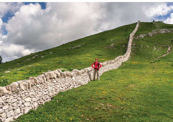
Trockenmauern prägen die Landschaft des Juras – hier am Mont Tendre.

Hôtel du Marchairuz, 021 845 25 30, www.hotel-marchairuz.ch Buvette du Mont Tendre, 021 864 37 19, www.buvette-mont-tendre.ch Buvette d'alpage Les Croisettes, 021 841 16 68, www.lescroisettes.ch Crêperie Sur les Quais, Le Pont, 021 841 11 30