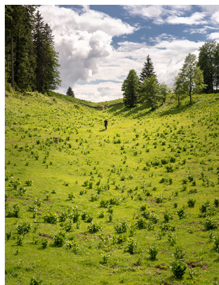
Ruhe pur im Tälchen zwischen Le Planet und Perroude du Vaud.