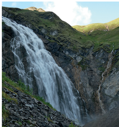
Höhepunkt der Wanderung sind die Entschligefälle.