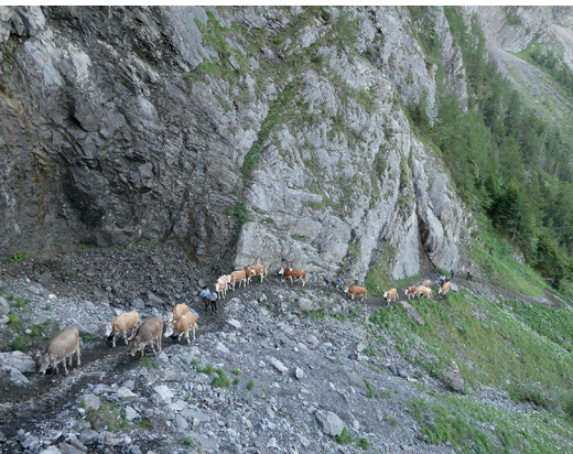
Zweimal im Jahr teilen die Wandernden ihren Weg mit den Kühen.

Datum des Alpaufzugs auf www.engstligenalp.ch Berghotel Engstligenalp, 033 673 22 91, www.engstligenalp.ch Restaurant Bergbach Unter dem Birg, 078 635 58 33, www.engstligenalp.ch