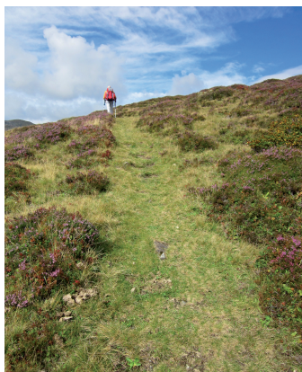
Der Aufstieg führt über Grashügel und durch Erika.