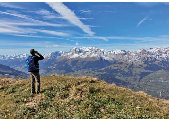
Vom Piz Mundaun aus ist der Blick auf die Surselva imposant.

081 933 16 00, fährt täglich von Juli bis Oktober