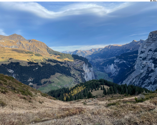
Das Lauterbrunnental und Gimmelwald immer fest im Blick.