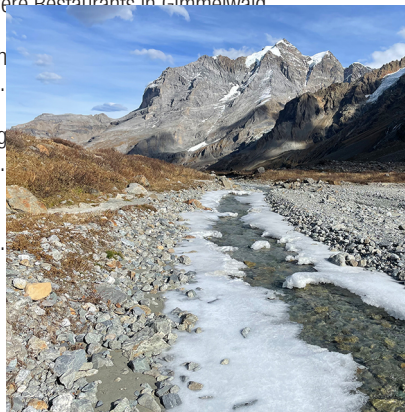
Im Vorfeld des Breithorngletschers beginnt neues Leben.