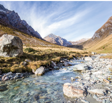
Am Eingang zum Val Maroz mit dem Bach Maira.