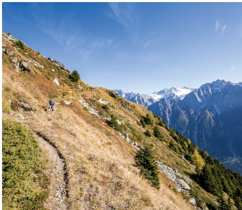
Zwischen Plan Lö und Cadrin folgt der anspruchsvollste Teil der Tour, den Flanken des Piz Duan entlang.