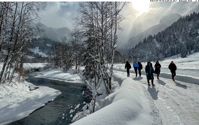
Der Winterwanderweg führt dem Louwibach entlang.

Beizli Bochtehus, 033 765 30 34, www.beizli.ch